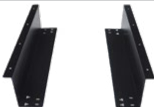
UCHWYT MONTAŻOWY DO SZUFLAD CASOWYCH (DO WYMIARU 350 ORAZ OD 410)

Na zdjęciu ukazana jest zamykana pokrywa wraz z wkładem do szuflady.