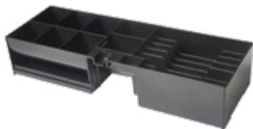
WKŁAD SZUFLADY CFT-460